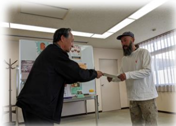
Music Is Religion