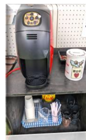
コーヒーを飲んで活動支援♪