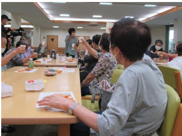
みんなで一緒にコーヒーで乾杯～！

この日は「いなべ10」の取材が入りました。10月1日(日)からCTYで1週間放送されます。