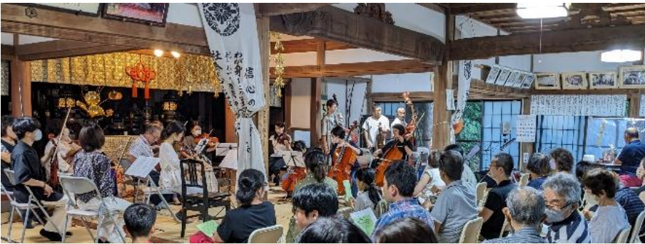
当日は子ども連れのファミリーからご年配の方まで満員御礼でした。

これから、定期演奏会や来年3月の「いなおペ」など、イベントが目白押しです。ぜひ皆さん、足を運んでみてはいかがでしょうか？