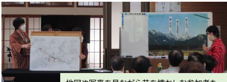
地図や写真を見ながら昔を懐かしむ参加者も。

今はもう、銚子の滝はないそうなのですが、こうして語り継ぐ人がいることによって歴史に残っていくのだと感じました。