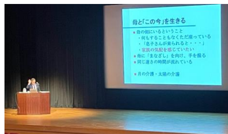
たくさんのお客さんが詰めかけました。