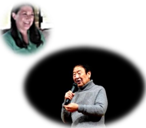
主催 いなべ市市民活動センター 共催 なないろのわ

参加者からは「上映会の内容は難しいものでしたが、用意された資料など、熱意が伝わりました」、「とても大切なことなので PTA や地域全体に広めたい」、「韓国や日本の一部でも実施されているオーガニック給食をいなべでも実現させたい」、「もっとたくさんの方が知るべき、もう一度開催してほしい」といった声がありました。