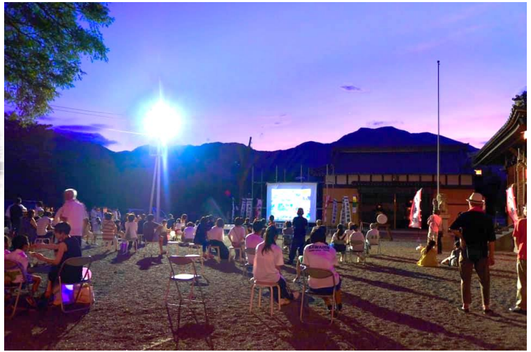
阿下喜祭好会による上映会の様子