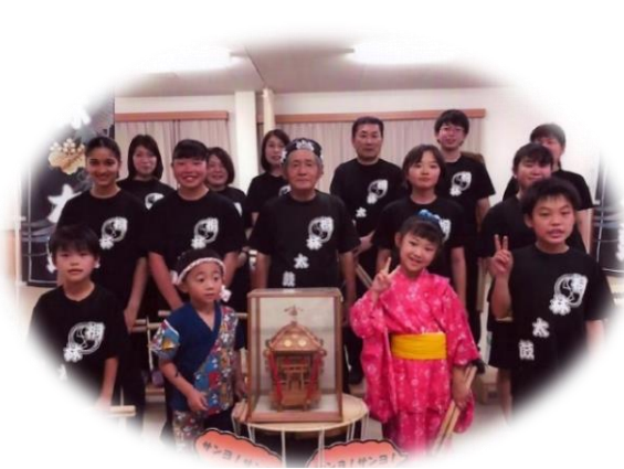
桐林太鼓のみなさん