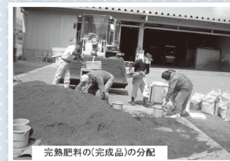
完熟肥料の(完成品)の分配