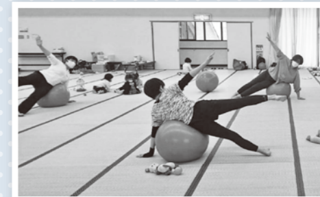
バランスボールの様子

未就園児のママを対象に、リフレッシュしていただけるイベントを開催しています。次回の予定は3月の員弁老人福祉センターです。詳しくはホームページまたはInstagramをご覧ください。お子様の見守りフォローもあります。