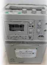
スピーカー (マイク)