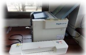
紙折り機とラミネーター