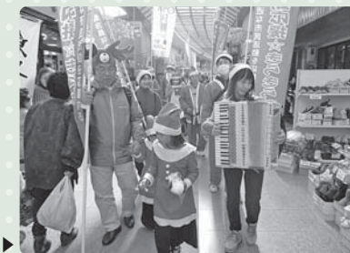
昨年のサンタの行進です▶